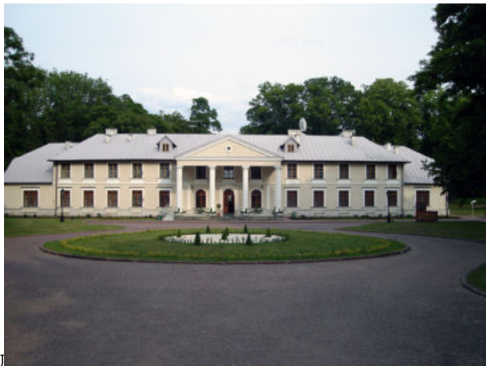
HOTEL*** RYTWIANY - PERŁA REGIONU