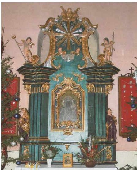
Ołtarz w kaplicy św. Benedykta.