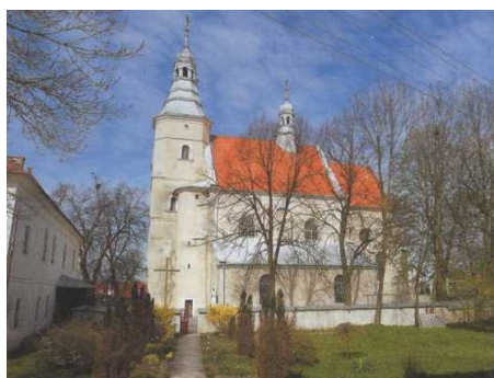
Kościół pw. WNMP w Koniemłotach od strony południowej.