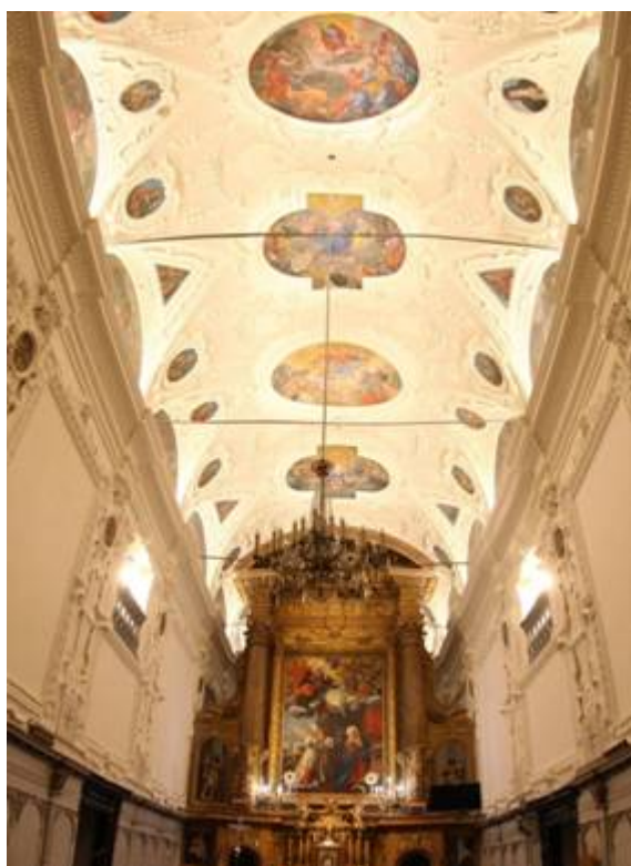
Fot. 4. W. Kowalewski Odnowione wnętrze nawy głównej w 2021 r. i podświetlone sklepienie w 2020 r.