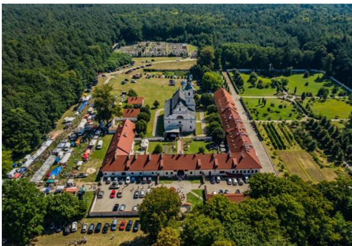
Fot. 2. S. Rakowski .Widok z lotu ptaka Odpust klasztorny w 2021 r.