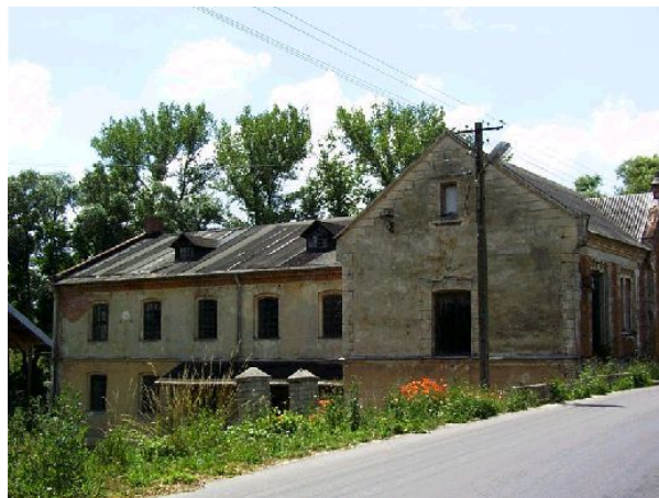
Młyn na Grobli

Inne z ciekawych obiektów to: ruiny gotyckiego zamku obronnego z XV w. w Rytwianach wraz z