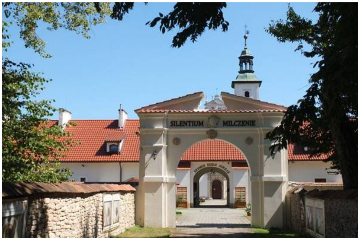
Fot. 3. A. Kos. Droga do świątyni - widok z tzw. szyi z 2020 r.