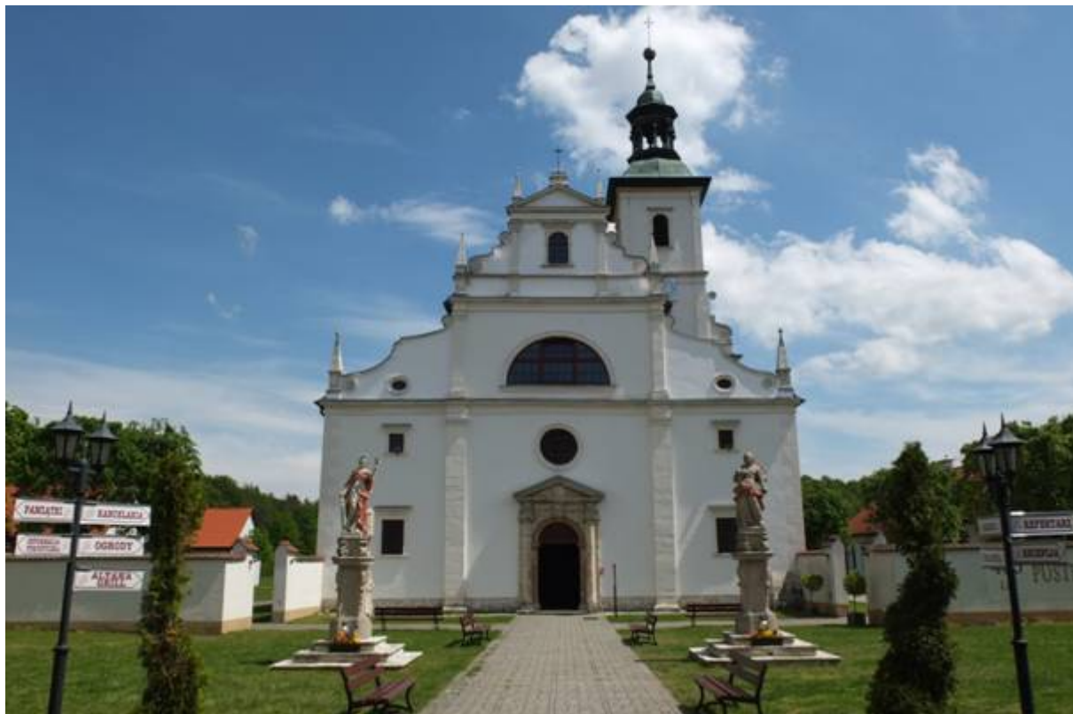
Fot. 6. A. Zwierzyńska - Kościół Rektoralny pw. Zwiastowania NMP w Rytwianach, pokamedulska barokowa XVII w. świątynia w 2020 r.