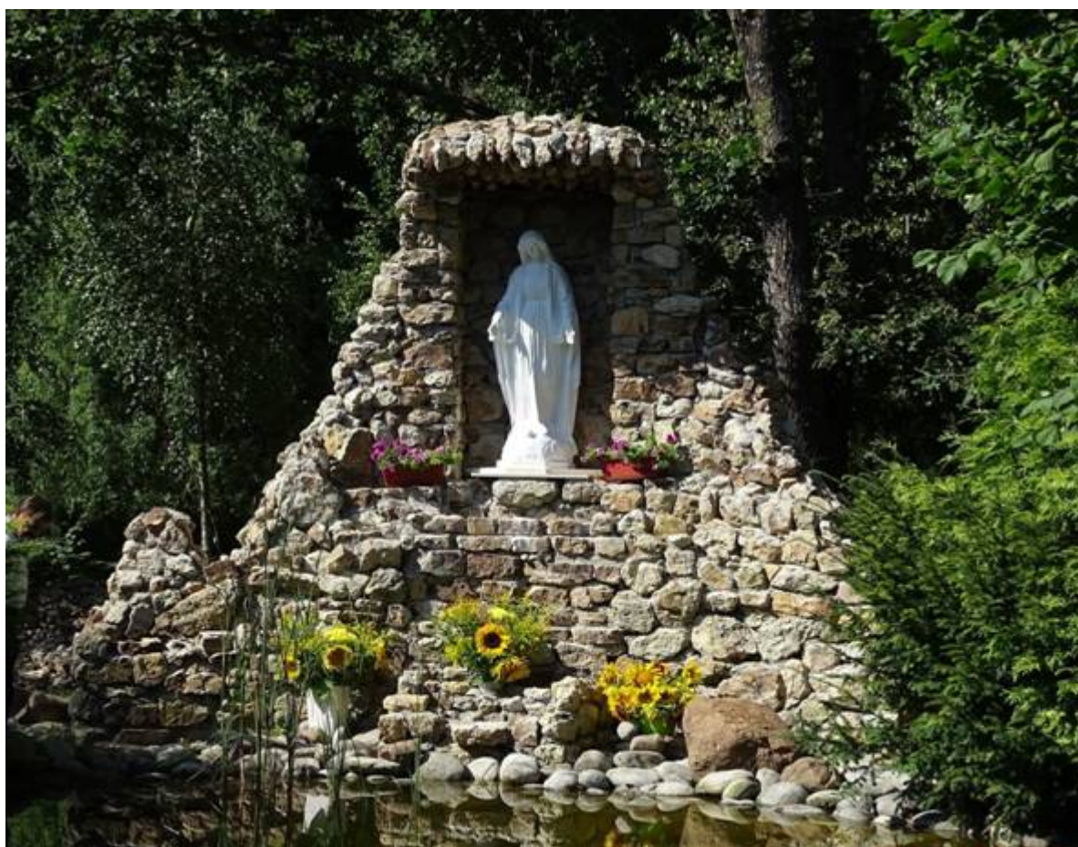
Fot.7. S. Ratusznik Grota Maryi Niepokalanej w ogrodach klasztornych w 2021 r.