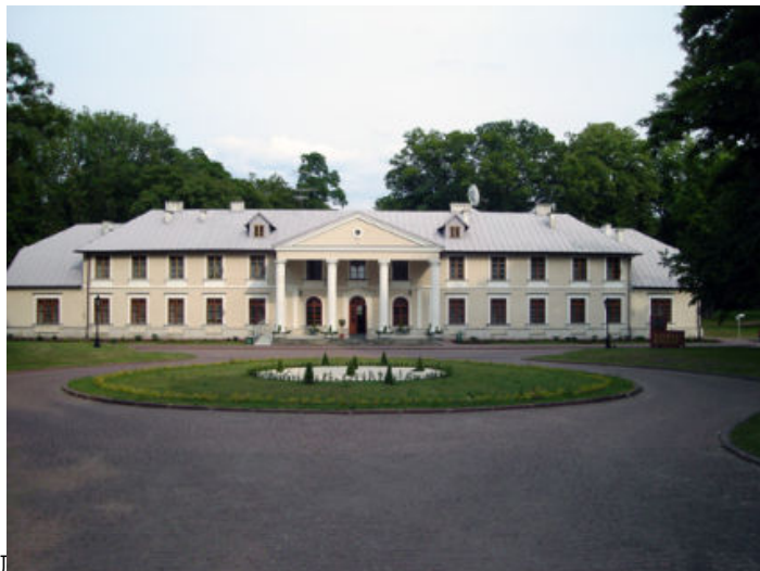
HOTEL*** RYTWIANY - PERŁA REGIONU