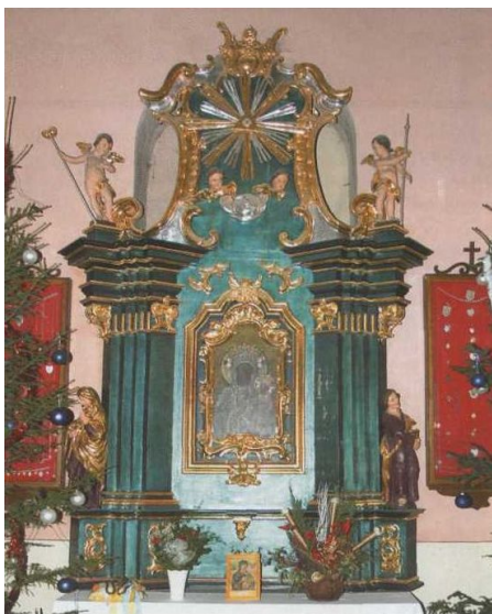
Ołtarz w kaplicy św. Benedykta.