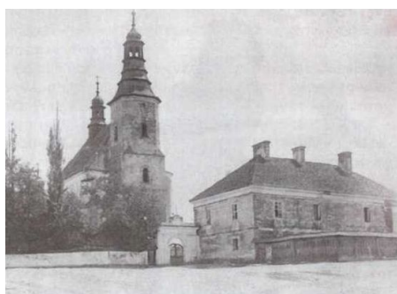
Zdjęcie z przełomu XIX i XX wieku

Około 1890 r. wybudowano budynki gospodarcze (oborę murowaną, stodołę murowano-drewnianą). W 1897 r. ks. Antoni Otrembski jak wynika z zapisów kroniki parafialnej "... zachęcił parafian do sprawienia okien w prezbiterium w miejscu starszych, zamurowanych."