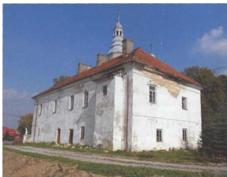
Budynek poklasztorny (stara plebania).