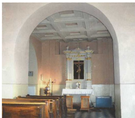
Ołtarz w nawie południowej.

Następne, większe prace remontowe przy kościele wykonano w latach 80. Odnowiono nawę główną i prezbiterium wraz z ołtarzami oraz pomalowano wewnątrz. Warto wspomnieć, że w tym okresie kontynuowano prace przy budowie nowej plebani. Prowadzone w 1988 roku prace przy kościele obejmowały zasadniczo wymianę tynków oraz w miarę potrzeb wymianę i uzupełnienie obróbek blacharskich. Ze względu na brak możliwości pokrycia rusztowaniami wszystkich elewacji równocześnie, prace realizowano przy elewacjach kolejno, od południowej do zachodniej. Uniemożliwiło to jednoczesną obserwację wszystkich odsłoniętych spod tynków murów, a co za tym idzie, sformułowanie optymalnych wytycznych konserwatorskich na lata przyszłe. Prace przeprowadzone zostały w miesiącach czerwiec - wrzesień 1988 roku i cechowały się znacznym pośpiechem. Oprócz podkreślonego systemu pracy po jednej elewacji, nie były one w pełni przygotowane. Chodzi tu głównie o zastosowanie tynku wapien-no-cementowego wobec braku starego wapna. Nie potraktowano też z należytą uwagą wszelkich istniejących, bądź nowoodkrytych elementów kamiennych.