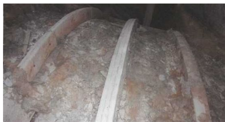
Sklepienie nawy głównej.

Akta Cywilno Religijne podług nowego prawa polskiego zaprowadzone.