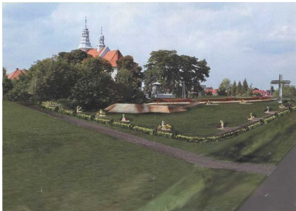
Widok na Kościół parafialny pw. Wniebowzięcia Najświętszej Maryi Panny wraz z projektowanym otoczeniem.