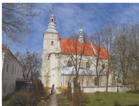
Kościół pw. WNMP w Koniemłotach od strony południowej.