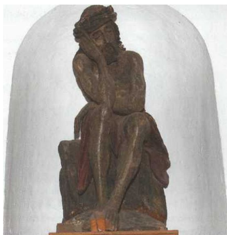
Portal z późnogotycką figurą Chrystusa Fratribus.