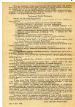
Testament Polski Walczącej (s. 4)