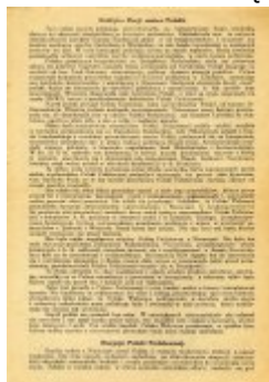
Testament Polski Walczącej (s. 2)