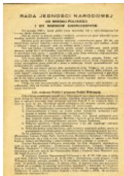
Testament Polski Walczącej (s. 1)