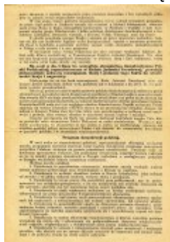
Testament Polski Walczącej (s. 3)