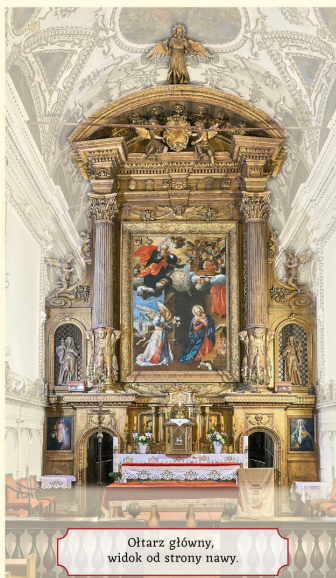
Ołtarz główny, widok od strony nawy.