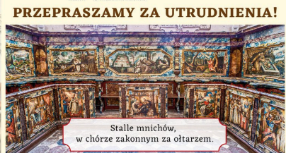
Stalle mnichów, w chórze zakonnym za ołtarzem.