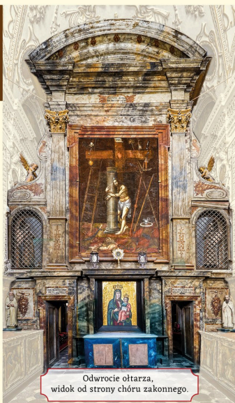
Odwrocie ołtarza, widok od strony chóru zakonnego.