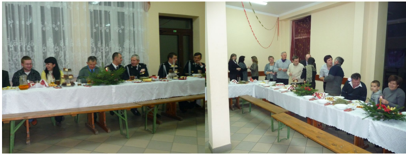
Gmina Rytwiany - www.rytwiany.com.pl/index.php?newsid=898